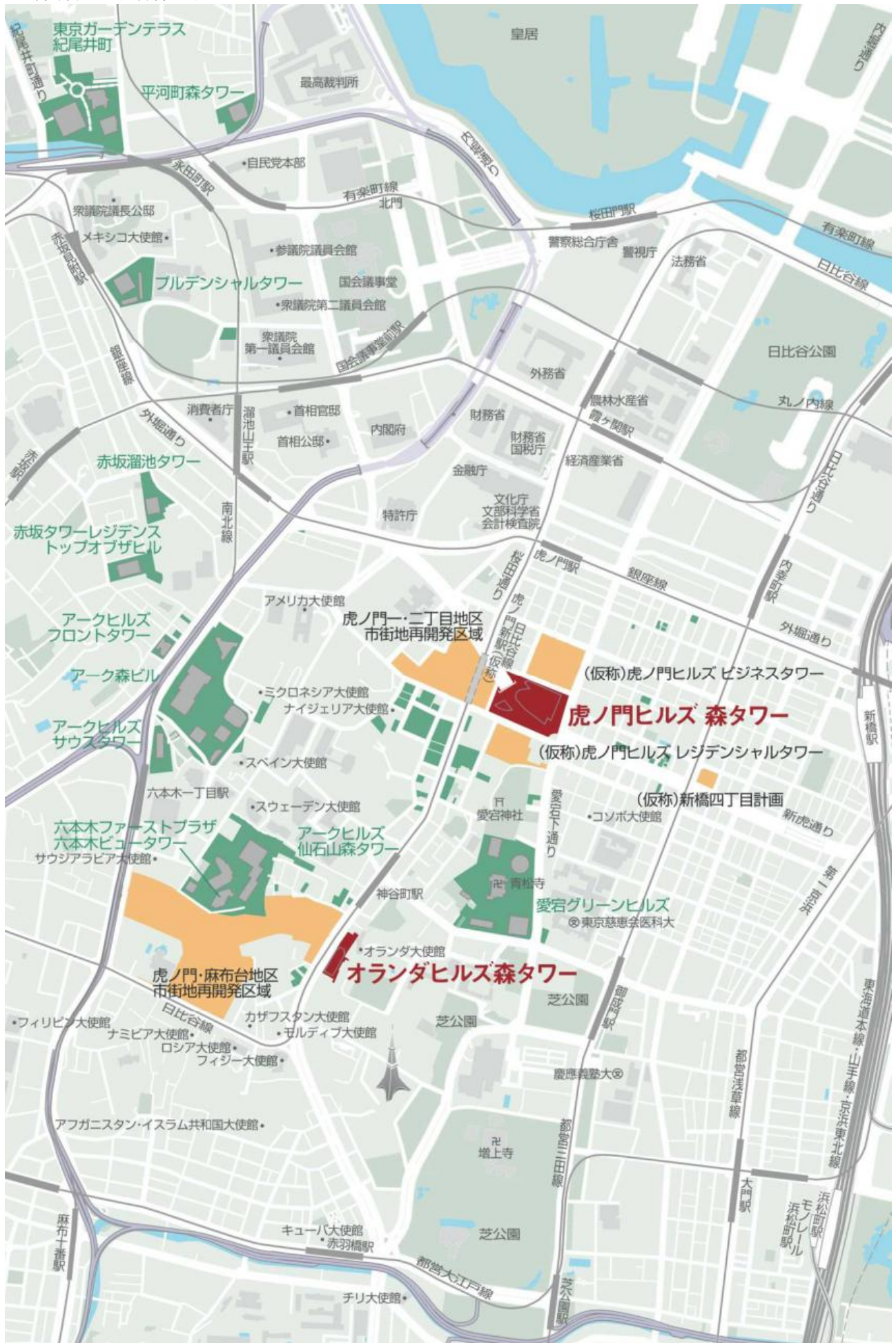
参考資料 3：物件案内図